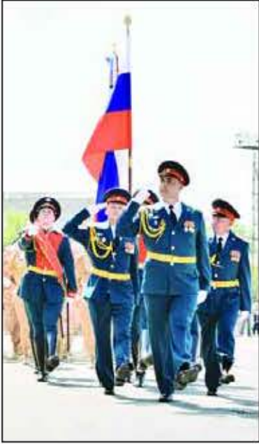
Начало на стр. 1

В заключение своей речи российский дипломат пожелал всем присутствующим крепкого здоровья и благополучия, а Армении — добра и процветания.